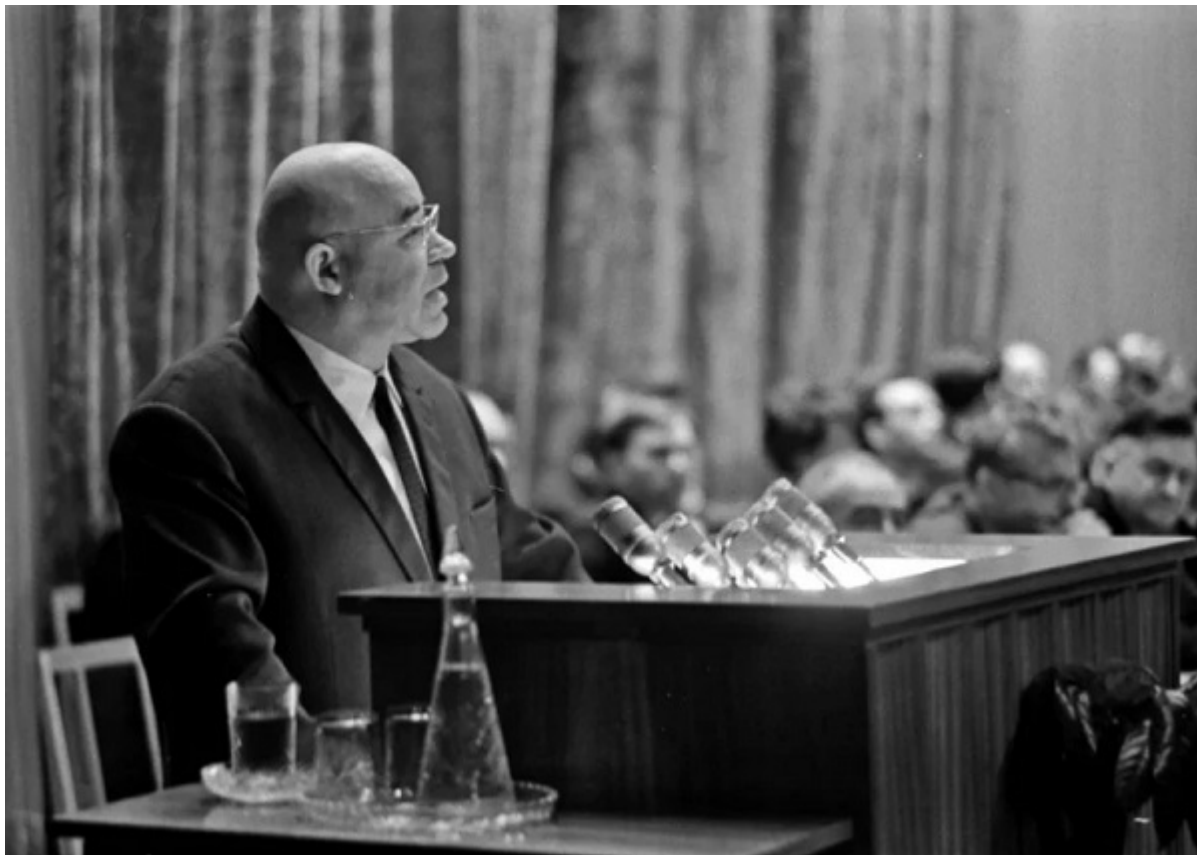
Выступает Петр Шелест, 1965 г.

В ином ракурсе рассматривал ситуацию первый секретарь ЦК КПУ Петр Шелест. В его дневниковых записях от 21-31 марта 1964 года есть такой абзац: