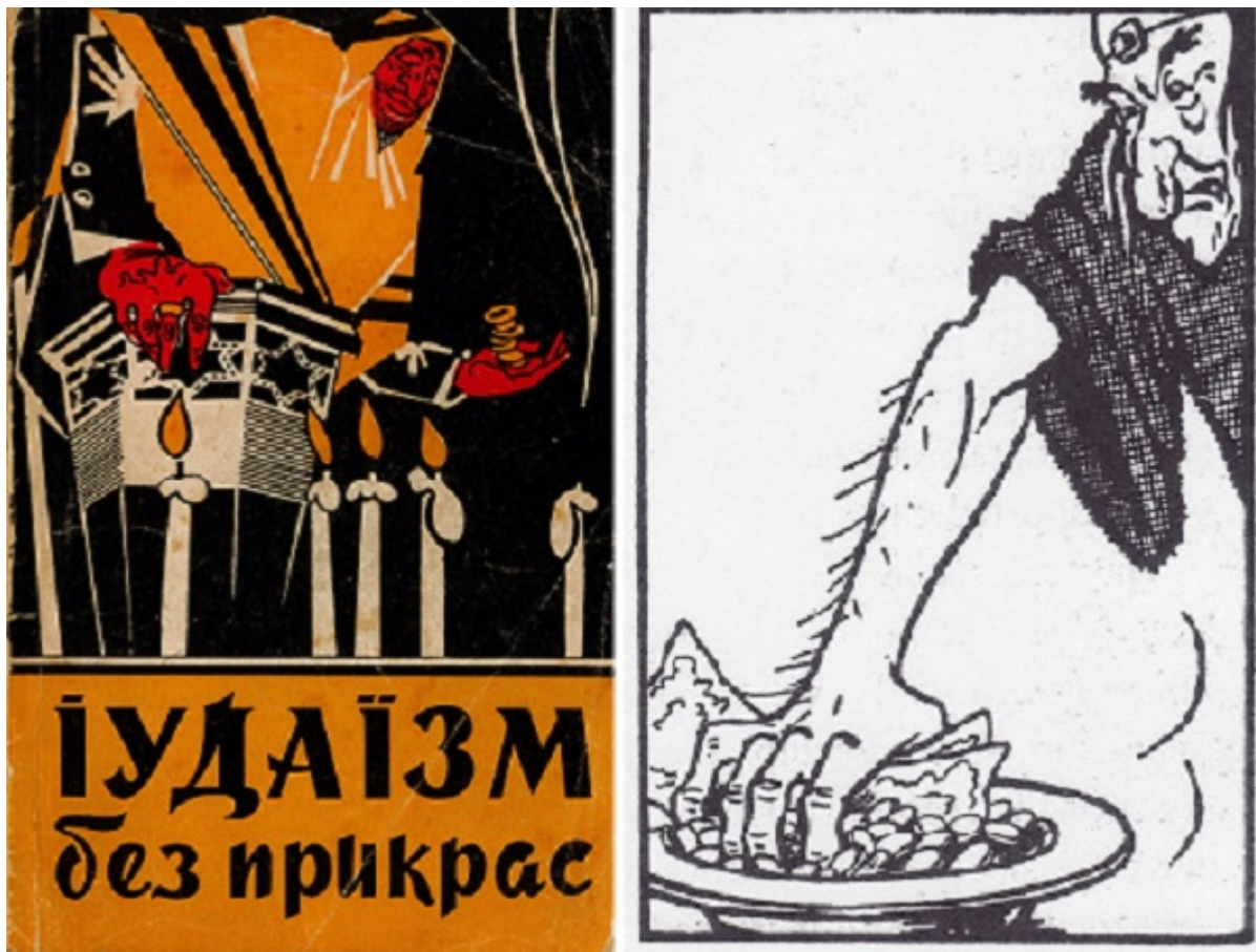
Обложка скандальной книги и одна из иллюстраций

Сотни «антисионистских» книг и брошюр миллионными тиражами выходили в последние десятилетия советской эпохи. Несть числа авторам, обеспечившим себе постоянный доход критикой «еврейского буржуазного национализма». И все-таки один из классиков этого жанра стоит особняком. Его имя в 1960-х было известно далеко за пределами УССР — Трофим Корнеевич Кичко. Творения не каждого партийного пропагандиста анализировались на страницах The New York Times и становились предметом обсуждения в ООН! Не о каждой антисионистской брошюре докладывали лично Хрущеву, и лишь одиозный автор «Иудаизма без прикрас» удостоился критики советских же идеологов, дезавуировавших эпохальный труд выдающегося антисемита. О феномене Кичко и международных скандалах, спровоцированных