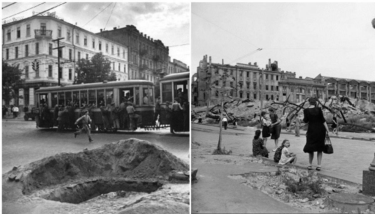
Киев конца 1940-х на фотографиях Роберта Капы

группами подпольщиков и вмешательством в эти разборки Винницкого обкома КПУ. Хотя в 1948-м формальный повод был другим — его уволили якобы за «пропаганду буржуазно-националистической идеологии» в ходе лекции «Националистическая сущность школы Грушевского».