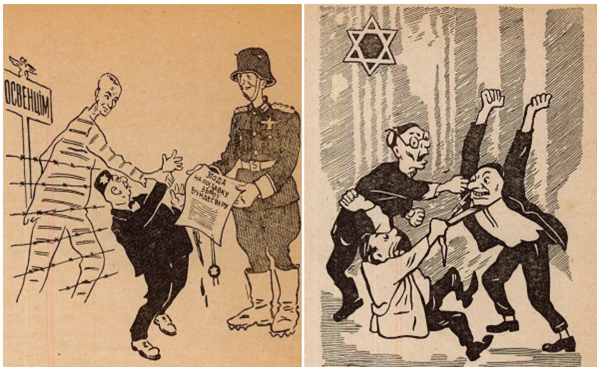
Иллюстрации из книги «Иудаизм без прикрас»

Спекуляция мацой, свининой, воровство, обман, разврат — вот настоящее лицо многих заводил синагоги. Ловкачи от религии превращают синагоги в свои собственные кормушки, распоряжаются пожертвованиями верующих, наживаясь на этом.