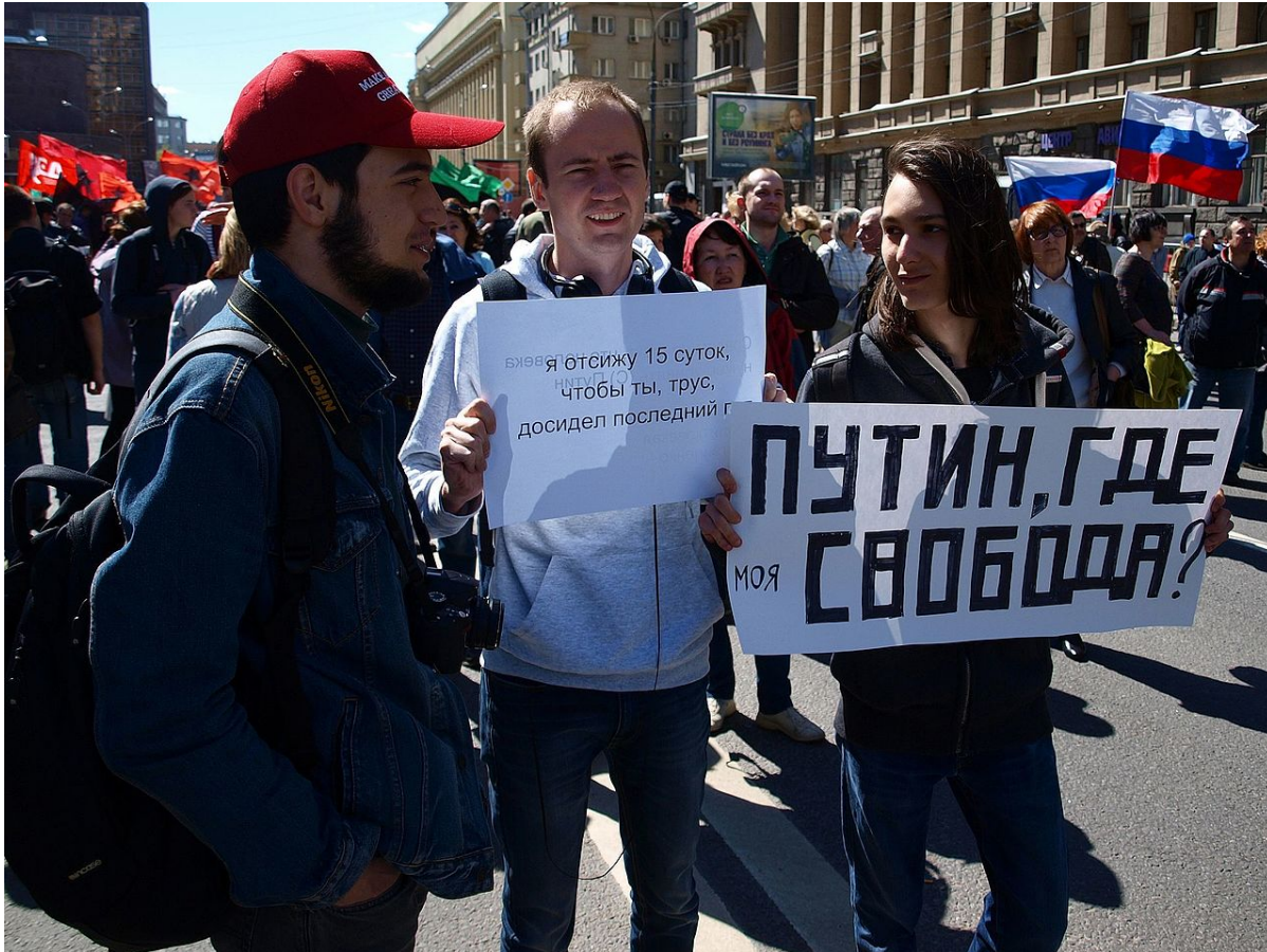
Митинг по случаю пятой годовщины «болотного дела». Москва, 6 мая 2017 года

этнический национализм, — говорит Альбац. — В какой-то момент произошло резкое усиление этно-националистических группировок. Большинство из них получали указания из Кремля. Я всегда говорила, что националистические организации как таковые не опасны, и объединяться на этнической основе вполне естественно. Страшно, когда знамя национализма поднимает государство. Именно это произошло при Путине, когда националистическая риторика стала риторикой правящего режима.