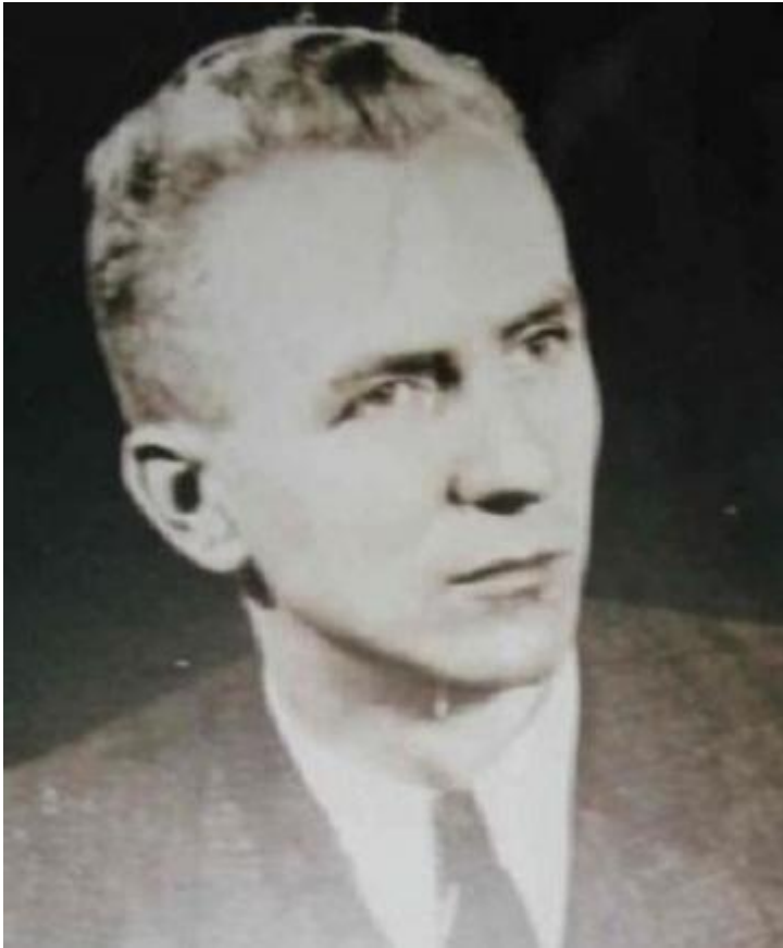
Карой Сабо, 1944