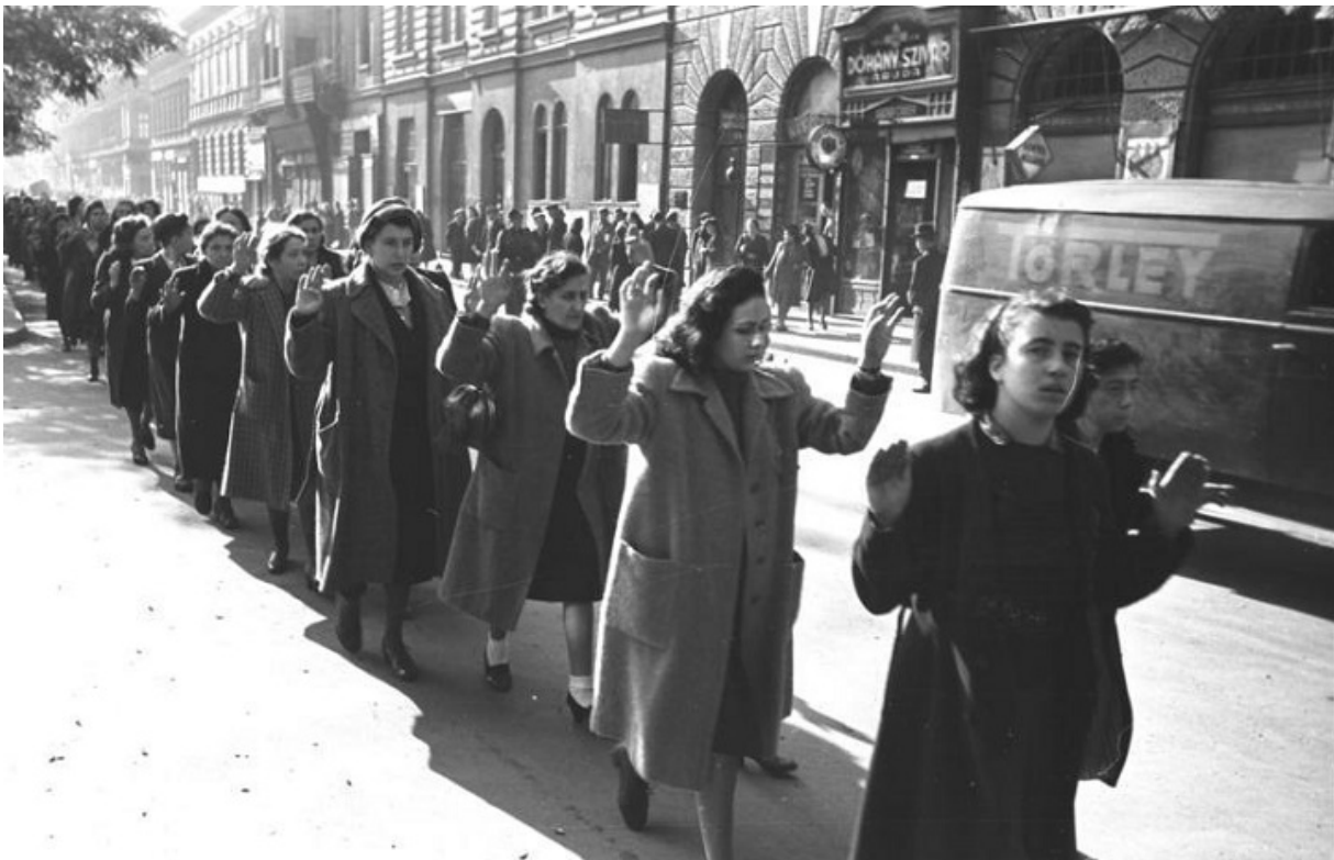
Єврейські жінки, заарештовані у Будапешті, 1944