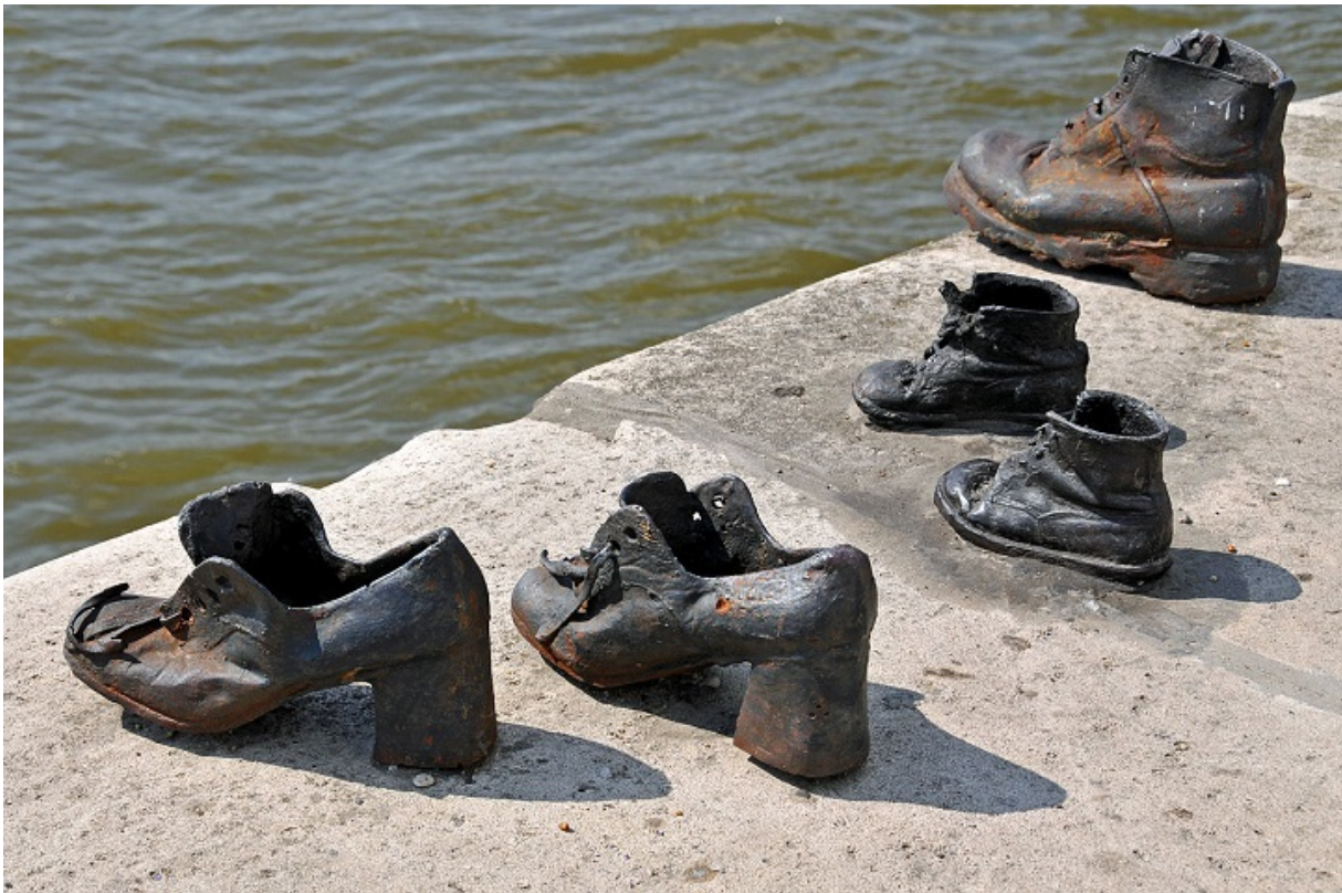
«Туфлі на набережній Дунаю» - меморіал пам'яті євреїв, розстріляних активістами «Схрещених стріл»

Становище євреїв, що жили у придбаних Валленбергом і захищених дипломатичним імунітетом будинках, з кожним днем все погіршувалося. З приходом Червоної Армії у місті запанувала анархія, на вулицях безчинствували банди угорських нацистів, які намагалися потрапити у дипломатичний комплекс під шведським прапором. Одна з таких спроб мала місце 24 грудня 1944 року — тоді Карой Сабо у чорній шкіряній куртці і поліцейською «ксівною», виданою Палаї, зумів звільнити 36 захоплених євреїв. З того часу він став відомим як «таємнича людина у шкіряній куртці». Після цієї події його помітив Валленберг, а Сабо, у свою чергу, організував зустріч шведа з Палом Салаї, який у силу займаної посади був обізнаний про плани нацистів щодо угорських євреїв.