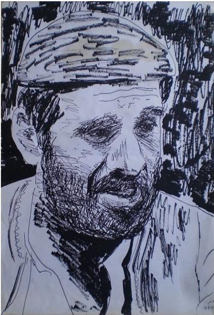
Автопортрет Хаима Тополя для роли в «Салах Шабати»