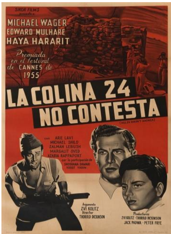
Постер фильма в испанском прокате