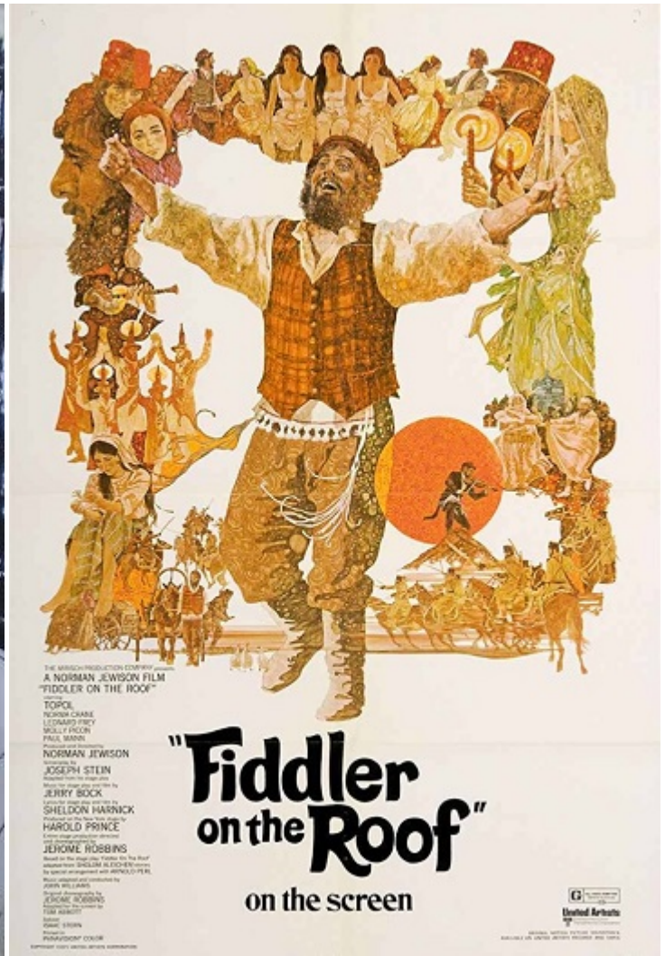
Афиша фильма «Скрипач на крыше»

Так было положено начало голливудской карьере. В 1966 году Тополь сыграл небольшую роль в крупнобюджетном фильме «Откинь гигантскую тень», где снялись такие звезды как Кирк Дуглас, Фрэнк Синатра и Юл Бриннер.