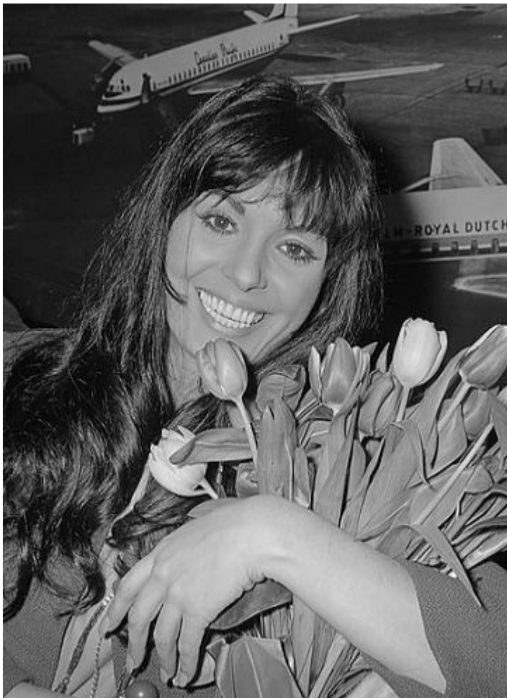
Далия Лави в 1966 году