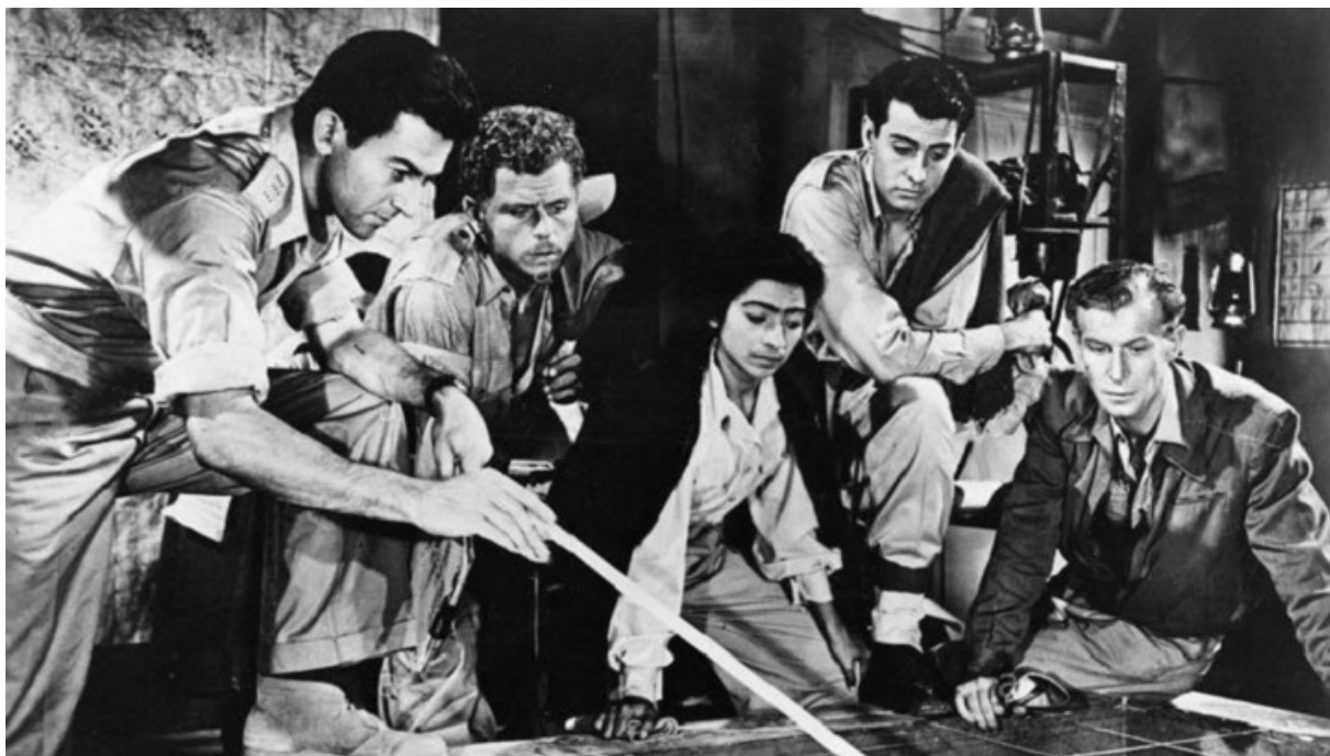
Кадр из фильма «Высота 24 не отвечает»