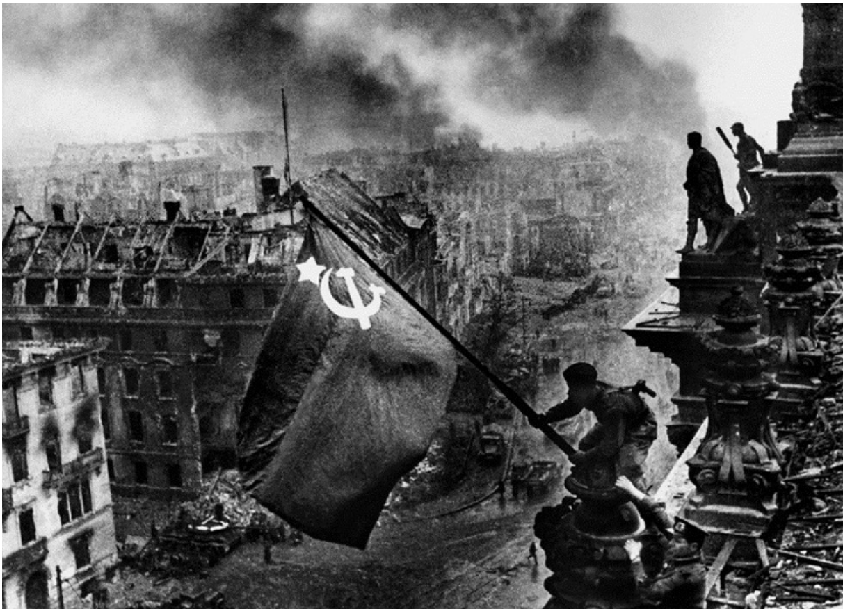
«Знамя победы над Рейхстагом».

Символами победы союзников во Второй мировой войне стали два фото: красное знамя над полуразрушенным Рейхстагом в Берлине и группа американских солдат, устанавливающих американский флаг на Иводзиме. Автор первого снимка — уроженец Юзовки Евгений Халдей. Во время еврейского погрома 13 марта 1918 года были убиты его мать (при попытке защитить сына) и дед, а сам годовалый Женя получил пулевое ранение в грудь. В 13 лет пришел на завод, тогда же увлекся фотографией и в 16 стал фотокором. С 1939 года Халдей — корреспондент «Фотохроники ТАСС». За четыре года войны прошел со своей камерой от Мурманска до Берлина. В историю вошли его кадры с конференции в Потсдаме и подписания акта капитуляции Германии. Фотографии Евгения Халдея были представлены в качестве вещественных доказательств на Нюрнбергском процессе .