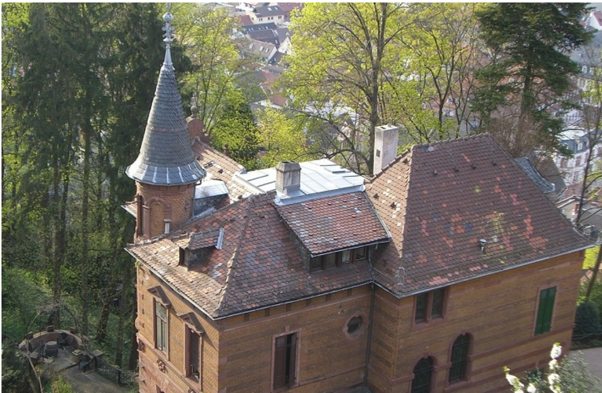
Здание братства Normannia в Гейдельберге