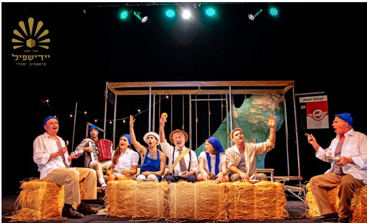
Сцена из спектакля театра «Идишпиль»

Существует обширная мифология о том, почему Бен-Гурион пошел на соглашение с харедим о статусе кво. Однако никакой политической подоплеки в этом не было. Ультраортодоксы тогда не участвовали в израильской политике. Бен-Гурион сам вспоминал, что встретился с их лидерами уже после того, как принял решение не вмешиваться в жизнь их общин, не призывать в армию студентов иешив и не принимать мер, ставивших под угрозу существование а идише ойлем — мира Торы, уничтоженного Холокостом. Политические проблемы с харедим начались только в 1970-х. На заре государства сионисты, очевидно, просто решили сохранить их, как Скандинавия — лапландцев.