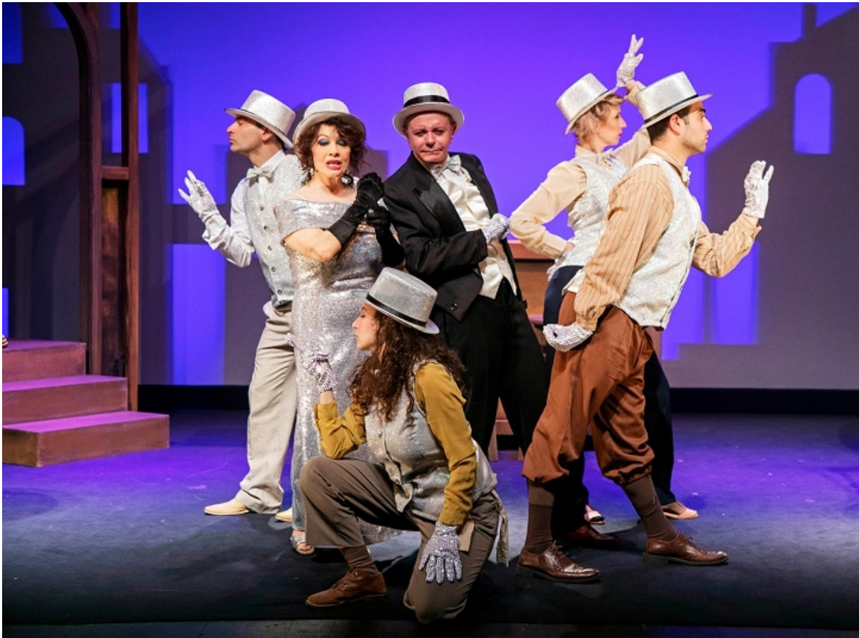
На одном из спектаклей театра «Идишпиль»

В воскресенье, 18-го июля 1948 года редактор коммунистической газеты «Коль ха-Ам» Меир Вильнер явился в военкомат по ул. Калишер в Тель-Авиве для несения воинской службы. На рутинный вопрос, какие языки он знает, Вильнер ответил: иврит, польский, немецкий и идиш. Офицер заявил, что идиш — не язык. Вильнер возмутился, но ему возразили, что издан приказ верховного командования: идиш — не язык. Ивритские газеты отнеслись к инциденту без удивления, мол, идиш — наследие галута (диаспоры), и в новом государстве ему нет места.