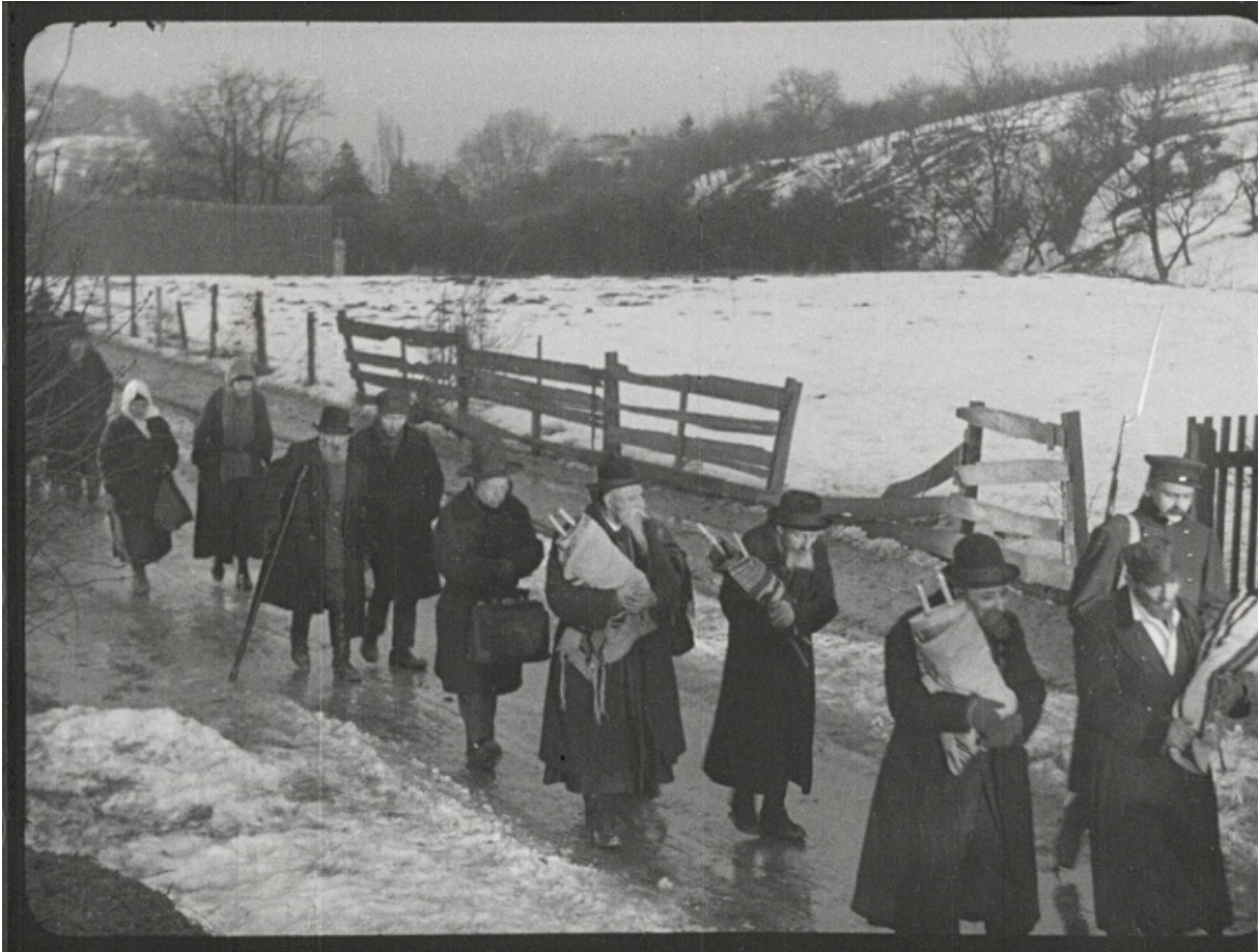
Кадр из фильма «Город без евреев»

Почти сто лет назад — в 1922 году — из-под пера известного австрийского писателя Хуго Беттауэра вышел роман под названием «Город без евреев». Этот сын львовского биржевого маклера в 18 лет оставил иудаизм ради почти несбыточной для еврея мечты — попасть в бригаду горных стрелков и сделать блистательную военную карьеру.