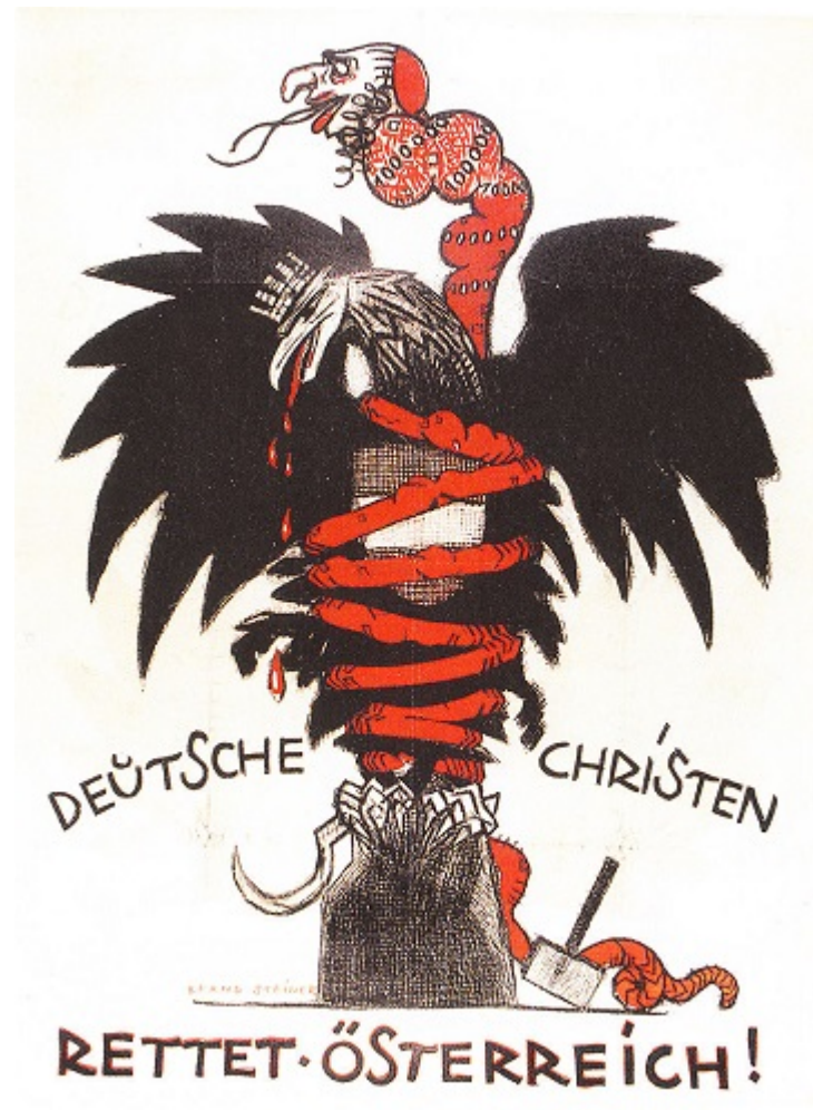
Антисемитский предвыборный плакат Христианско-социальной партии, 1920

На этом фоне возникает народное движение, требующее вернуть евреев обратно. В итоге закон об изгнании отменен, евреи возвращаются в Вену и приветствуются местными жителями. Беттауэр намекал, что сюжет книги ему подсказали откровенные разговоры посетителей в публичных местах и граффити на стенах вроде «Евреи, убирайтесь!» (Hinaus mit den Juden!). Книга произвела фурор, в первый же год было продано более 250 000 экземпляров — огромный тираж для 6,5-миллионной Австрии.