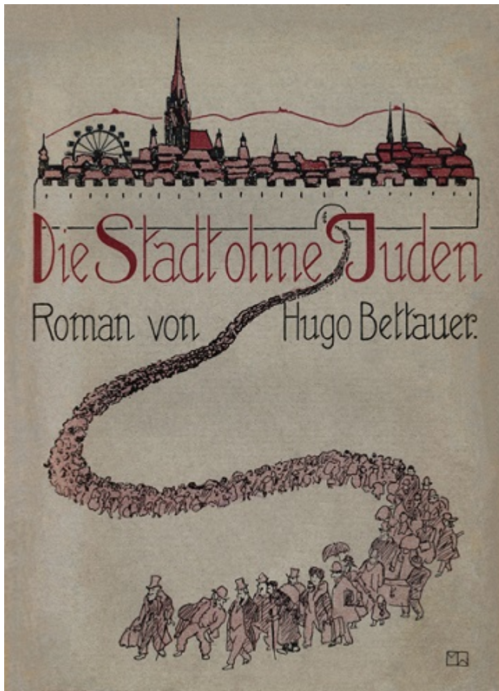
Обложка романа Хуго Беттауэра «Город без евреев»