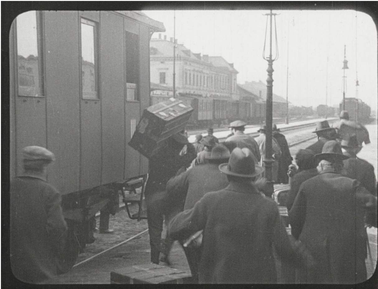
Кадр из фильма «Город без евреев»

И книга, и фильм оказались отчасти пророческими. К концу 1930-х Вена действительно оказалась городом без евреев, чему многие местные жители были весьма рады. После войны в столицу Австрии вернулись считанные из живших там до аншлюса 200 000 евреев.