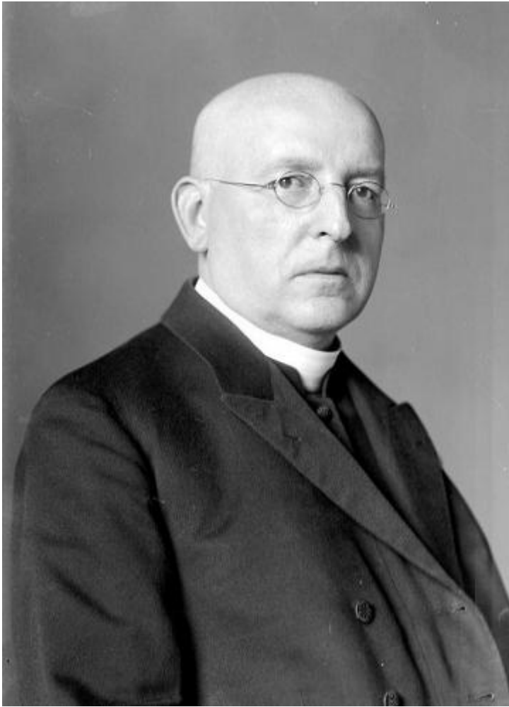
Федеральный канцер Игнац Зейпель