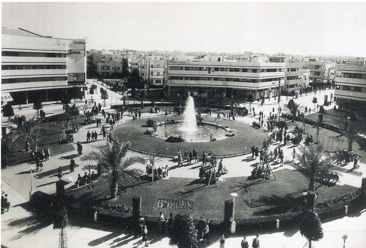
В центре Тель-Авива, 1940-е

Действительно, в 2020 году доля еврейского населения Израиля составила 73,9% по сравнению с 89,2% в 1957 году. Вместе с тем, доля расширенного еврейского населения, включающая всех лиц, подпадающих под Закон о возвращении, даже сегодня составляет 79% населения Израиля. Нелишне вспомнить, что в первые годы существования государства подход к определению еврейства был куда либеральнее, и многие потомки еврейских отцов евреев считались евреями даже без тщательного изучения биографии их бабушки. Впрочем, и сегодня за ответом на вопрос, кто является евреем, часто стоит не столько Галаха, сколько политика. Так, соответствующие органы проявили удивительную гибкость, признав фалашмура евреями. Никто (и вполне справедливо) не поднимал вопрос о проверке ДНК этих новых евреев, как это иногда происходит в случаях с потомками выходцев из российской черты оседлости.