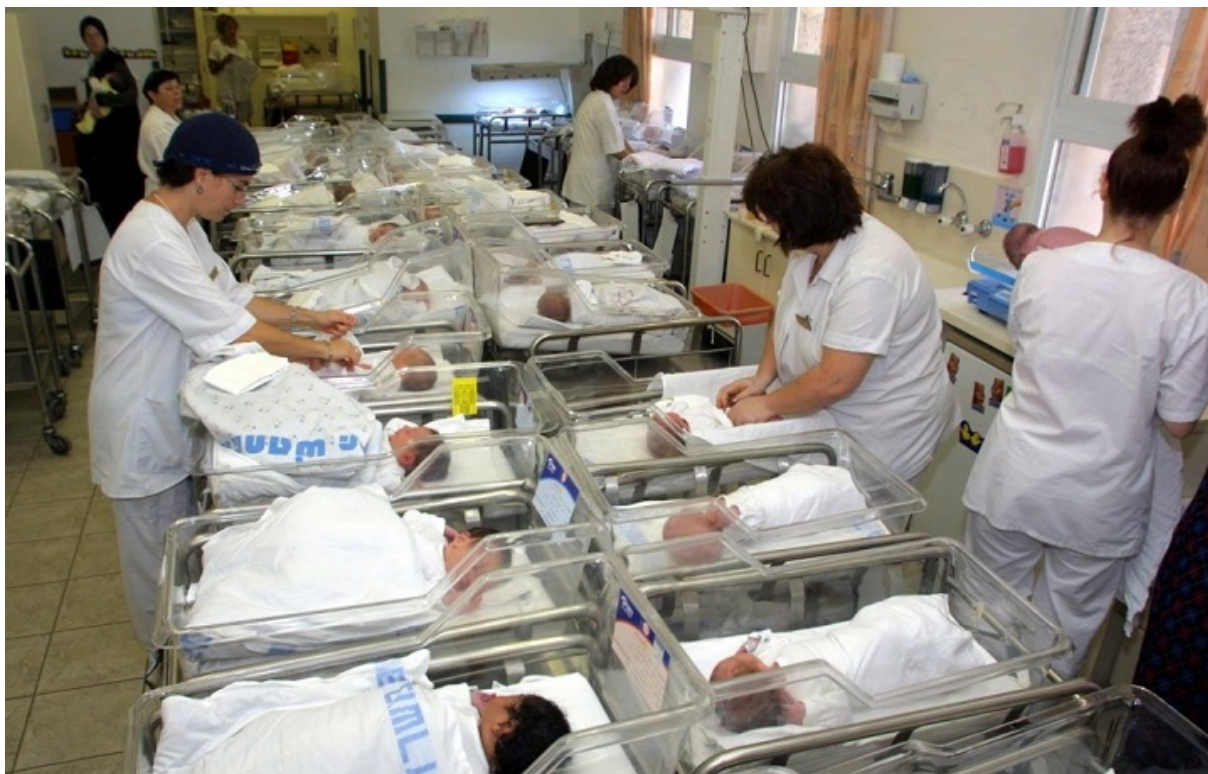
Современное родильное отделение «Бикур холим», Иерусалим