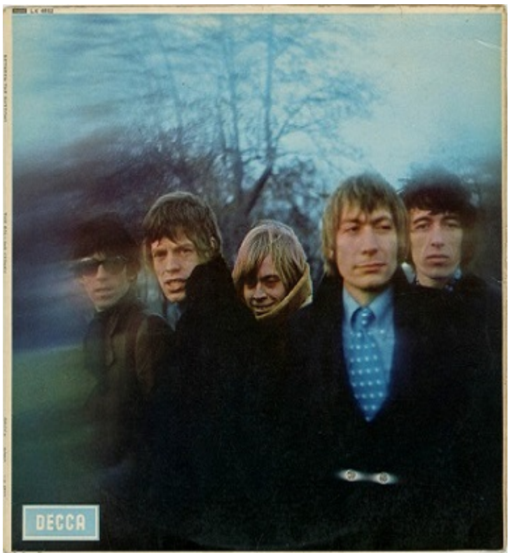
Обложка альбома Between the Buttons