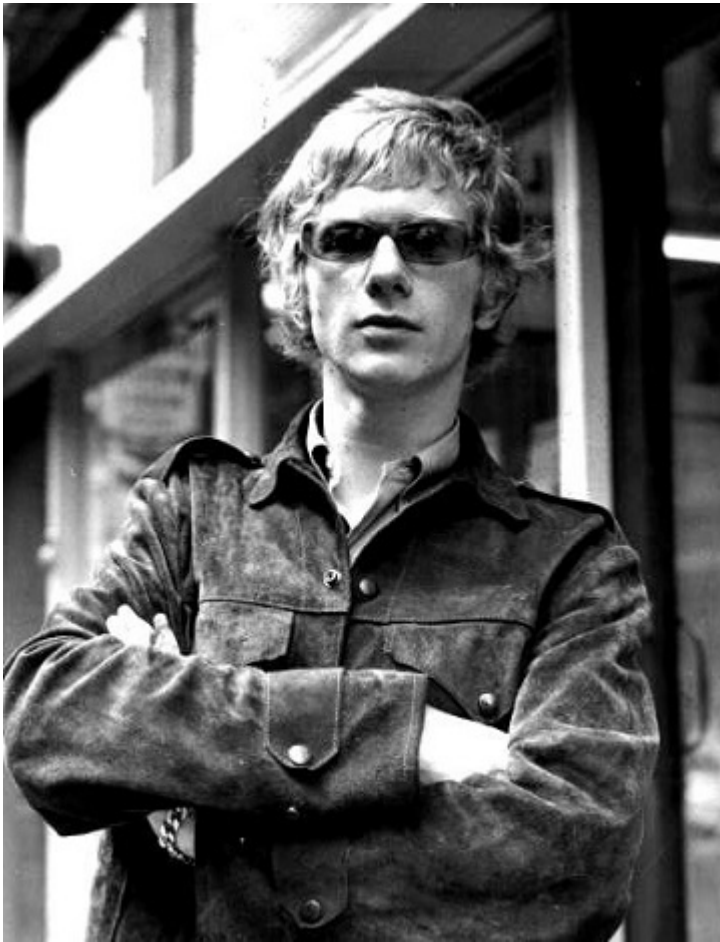
Эндрю Луг Олдем

У соперников The Beatles — The Rolling Stones — тоже был свой «Эпштейн», даже несколько. Образ группы в стиле «плохих парней» придумал один из первых ее менеджеров Эндрю Луг Олдем — сын австралийской еврейки и погибшего в 1944-м лейтенанта ВВС США. Эндрю увлекся поп-культурой еще в отрочестве, работал с Бобом Диланом во время его первого турне по Британии, а в апреле 1963-го впервые услышал The Rolling Stones.