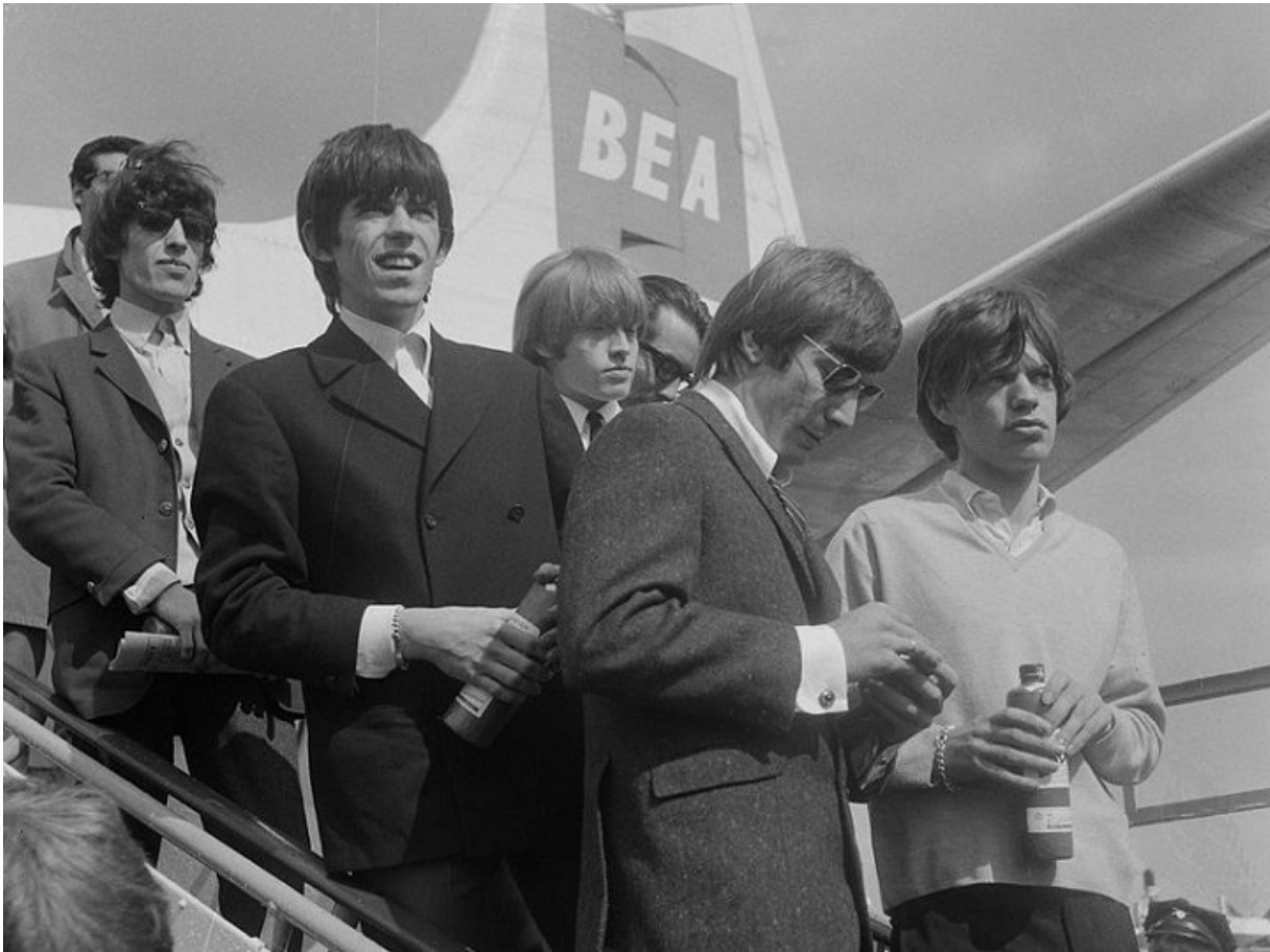
The Rolling Stones в аэропорту Амстердама, 1964

Трудно найти человека, даже далеко от рок-музыки, не слышавшего о The Beatles и The Rolling Stones. Ключевую роль в восхождении ливерпульской четверки к мировой славе сыграл потомок литовских и российских евреев Брайан Эпштейн. Этому человека даже называли «пятым битлом». Именно он разработал сценический имидж The Beatles, организовал запись их первого альбома и многочисленные гастроли. Если бы не смерть от передозировки снотворного в 32 года, Эпштейн открыл бы еще немало талантов.