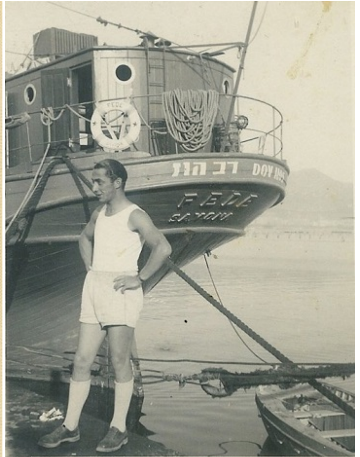
Леон у судна Fede, Италия

Через несколько дней 1014 евреев, включая беременных женщин, объявили голодовку, требуя разрешения на въезд в Эрец Исраэль. В Иерусалиме к акции подключилось Еврейское Агентство, чиновники которого из солидарности голодали вместе с беженцами.