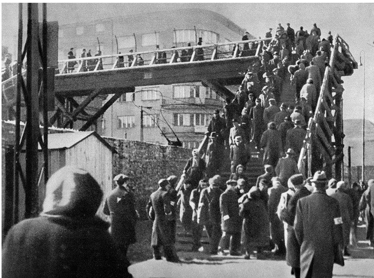
Пешеходный мост, ведущий в Варшавское гетто, 1942

После волны депортаций, юноша вступил в Еврейскую боевую организацию (Żydowska Organizacja Bojowa, или ŻOB) — крупнейшую из ячеек еврейского Сопротивления. «В 1942-м, когда мне было 18 лет, а маме 40, ее увезли в Трешлинку. Однажды я вернулся с принудительных работ, и ее уже не застал», — вспоминал мужчина в интервью Ynet в 2018 году. За два месяца в лагере смерти депортировали тогда из Варшавы более 250 000 евреев.