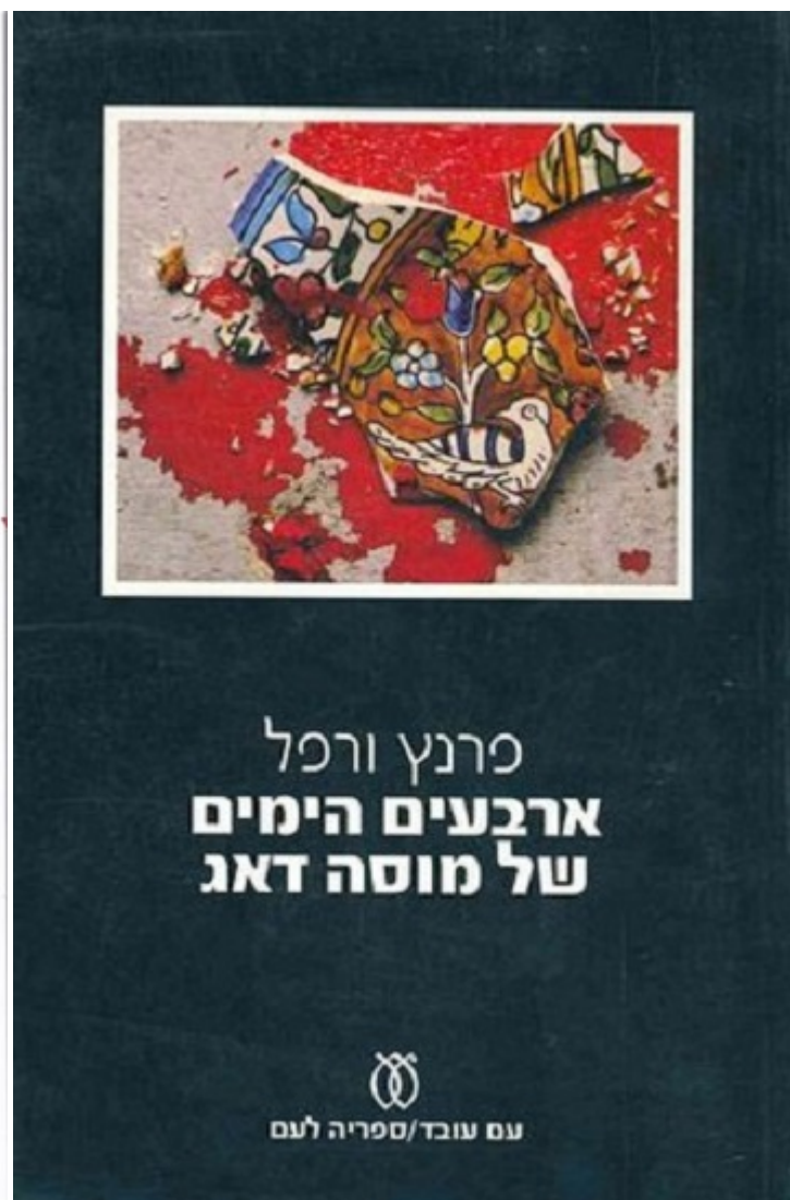
«40 дней Муса-Дага»

Еврейский ишув в Палестине готовился героически погибнуть, отражая нашествие войск Роммеля. Пример армян, вставших на защиту своих семей в Муса-Даге, вдохновлял палестинских евреев. Когда-то книга Верфеля входила в программу израильских школ, и вряд ли кто-то мог себе представить, что юноши, читавшие в юности «Муса-Даг», став политиками и дипломатами, будут всячески поддерживать турецкие попытки отрицания армянского геноцида.