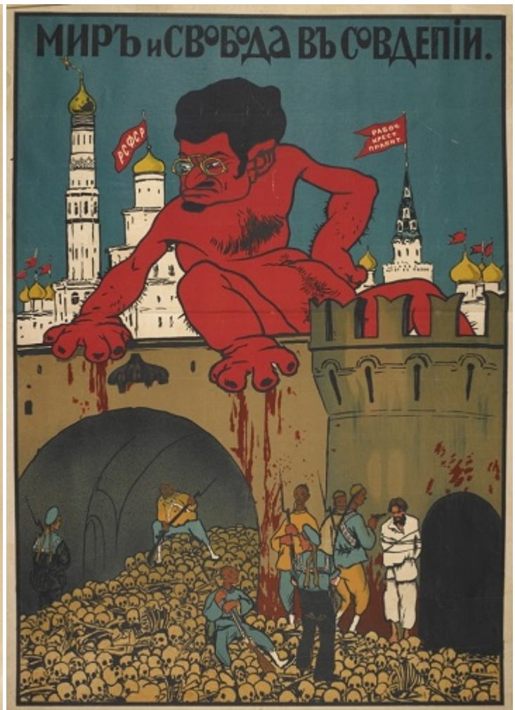
Белогвардейские карикатуры на Троцкого