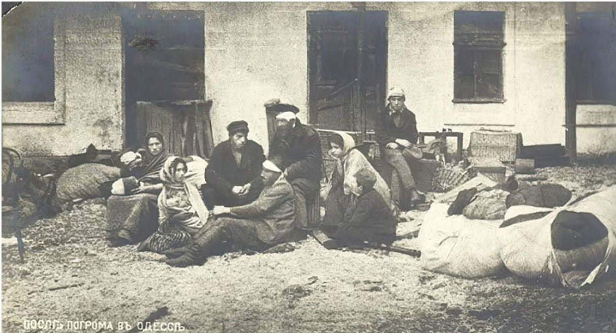
После погрома в Одессе