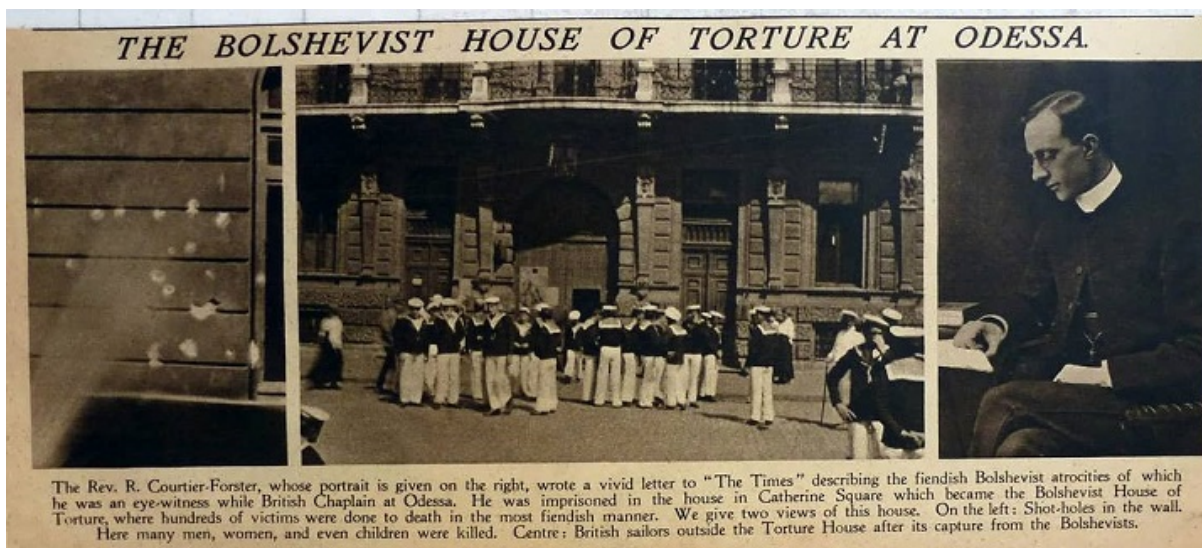
Заметка в английской The Times о зверствах Одесской ЧК, 1919

А спустя время «меч революции» опустился и на Наума, задержанного на границе с письмом, которое он вез от изгнанного Троцкого к Радеку.