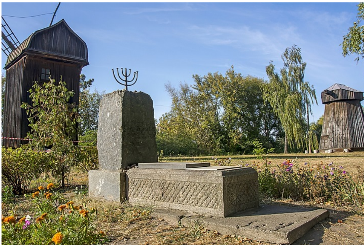
Памятный знак на территории бывшего еврейского кладбища

Похоронили их на еврейском кладбище, уничтоженном в 1956-м по приказу исполкома. Тогда же бульдозером снесли все мацевы, а на месте кладбища возвели Музей народной архитектуры и быта Средней Надднепрянщины. Но до сих пор могильными плитами устланы откосы холма, на котором находится музей. Остался лишь памятный знак этому кладбищу, установленный в свое время Еврейским фондом Украины.