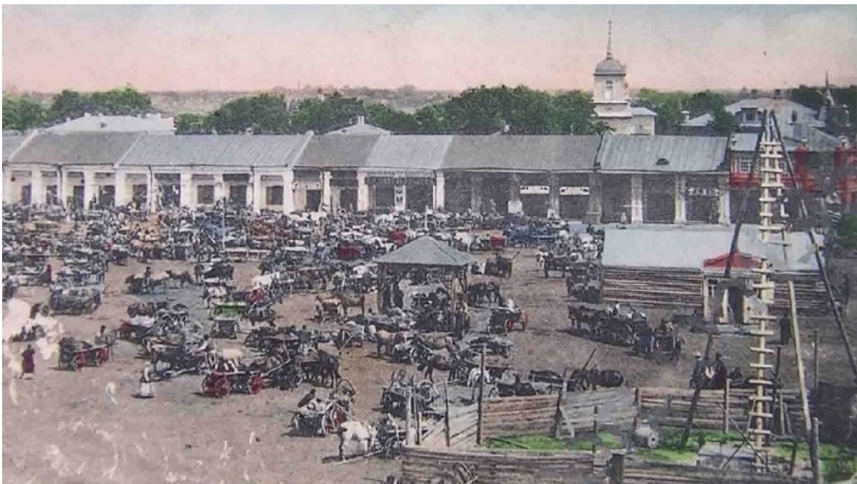
Базарная площадь Переяслава в начале XX века