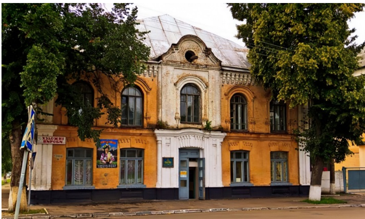
Здание бывшей синагоги в Переяславе