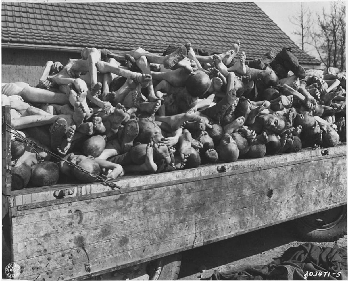
Трупы узников, найденные после освобождения