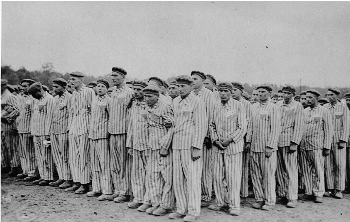
Узники Бухенвальда на перекличке