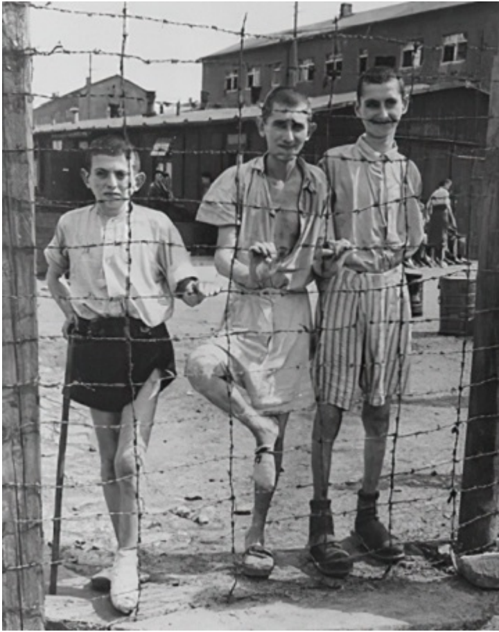
Спасенные еврейские дети из Бухенвальда