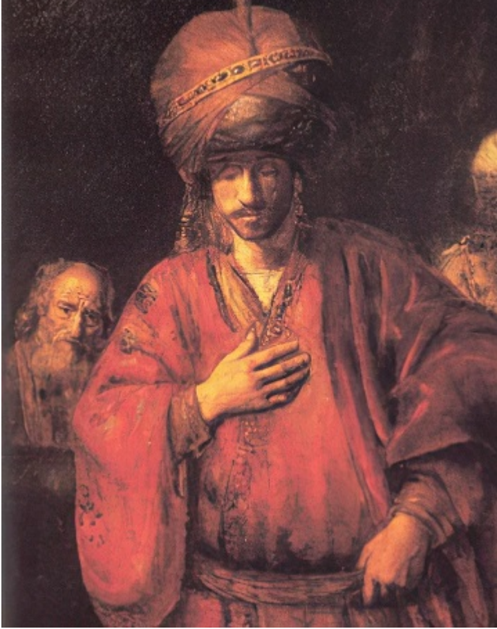
Деталь картины Рембрандта «Давид и Урия»

Тогда царь опять вызвал воина к себе и спросил: «Вот, ты пришел с дороги; отчего же не пошел ты в дом свой?»