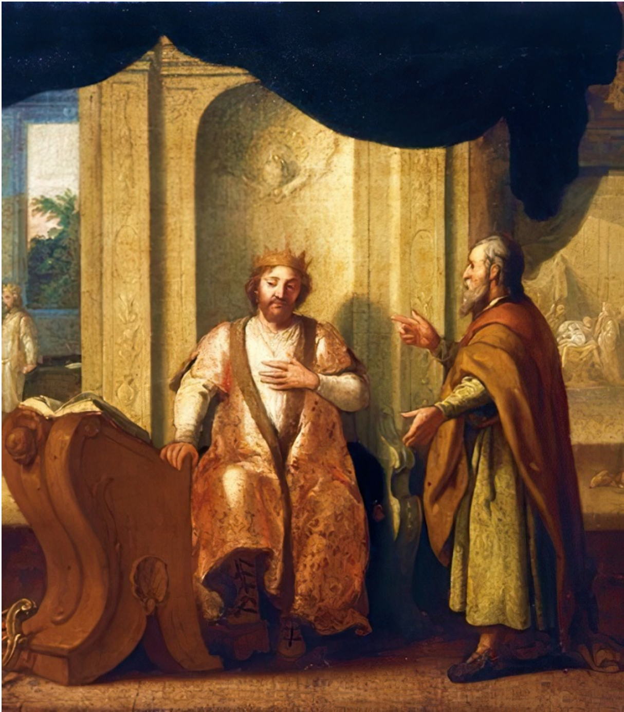
«Натан с царем Давидом», худ. Маттиас Шейтс

Лишь в этот момент Давид понял цель визита пророка. «Согрешил я пред Господом», — отреагировал он, желая смягчить наказание. И в ответ Натан оглашает вердикт: