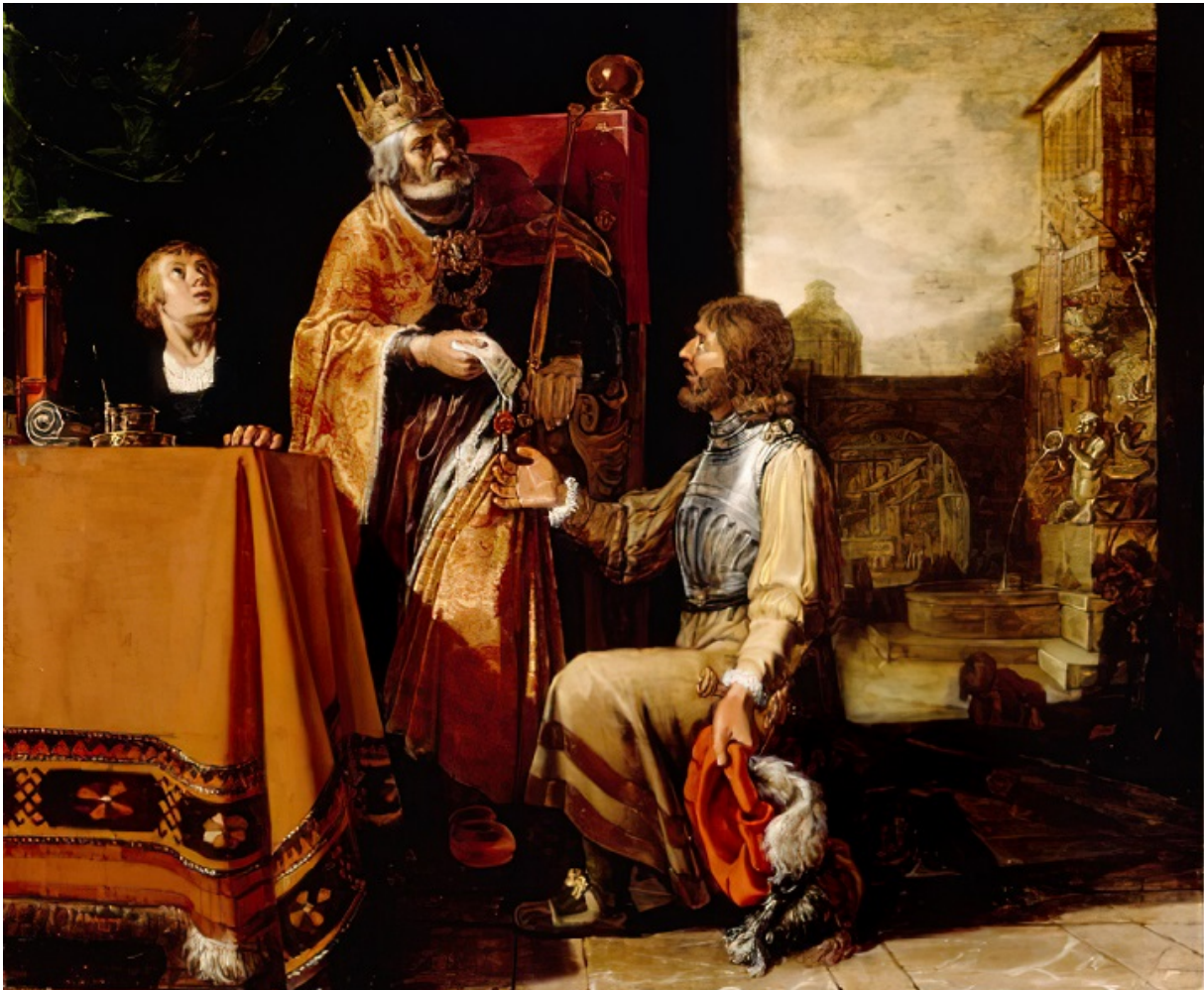
«Давид передает письмо Урии», худ. Питер Ластман, 1619

Разумеется, Урию вместе с несколькими воинами послали на смертельное задание, где они и погибли. Чтобы убить мужа красавицы Иоав был вынужден отправить на смерть других людей, но царь одобрил действия главнокомандующего, сказав посыльному: «Так скажи Иоаву: пусть не смущает тебя это дело, ибо меч поедает иногда того, иногда сего».