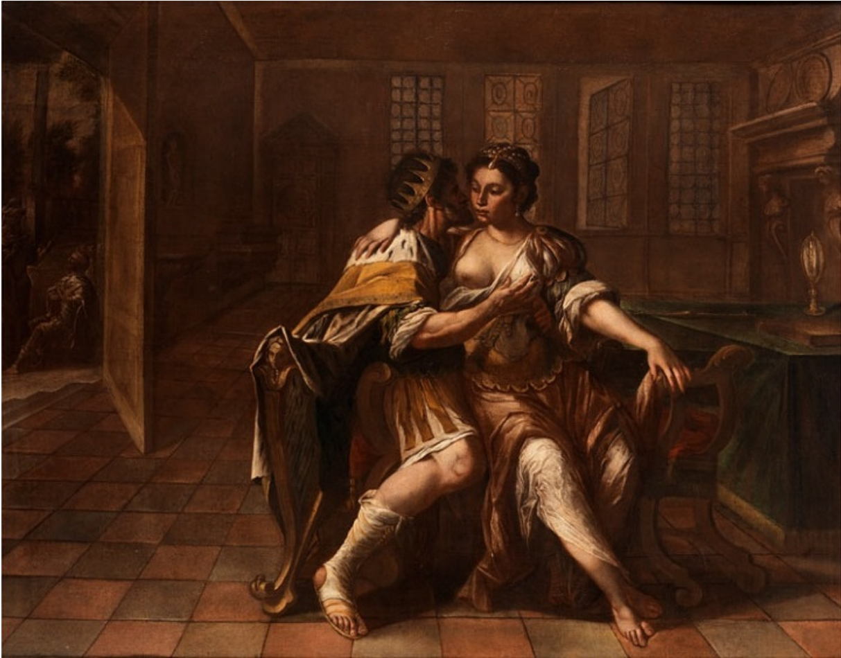
«Давид соблазняет Бат-Шеву», полотно неизвестного художника XVII века

Обсуждаемое дело современные юристы квалифицировали бы как действия, имеющие целью убийство при отягчающих обстоятельствах и использование служебного положения в корыстных целях. Итак, что же происходит в 11-й главе Второй Книги царств?