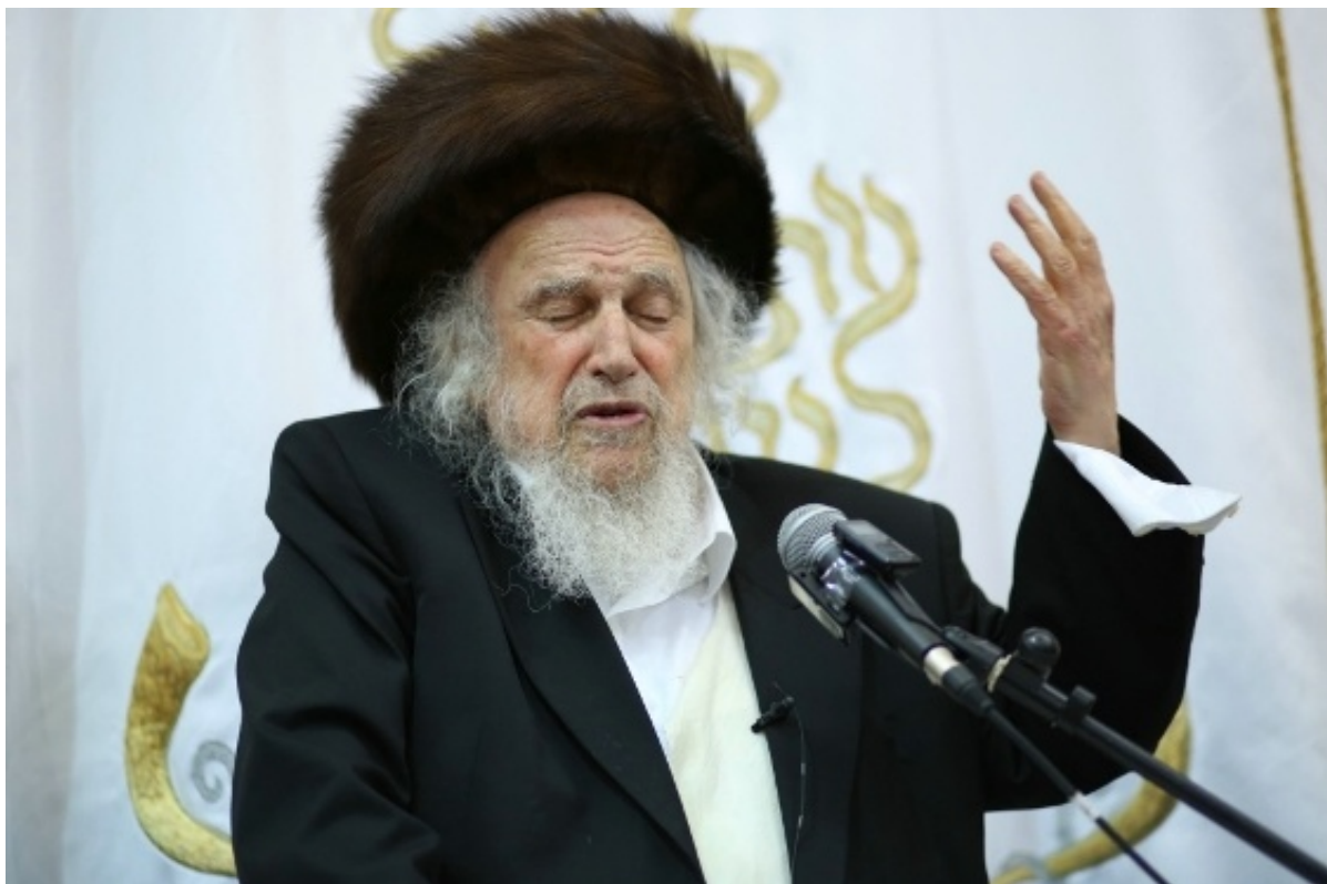
Рав Шмуэль Ойербах