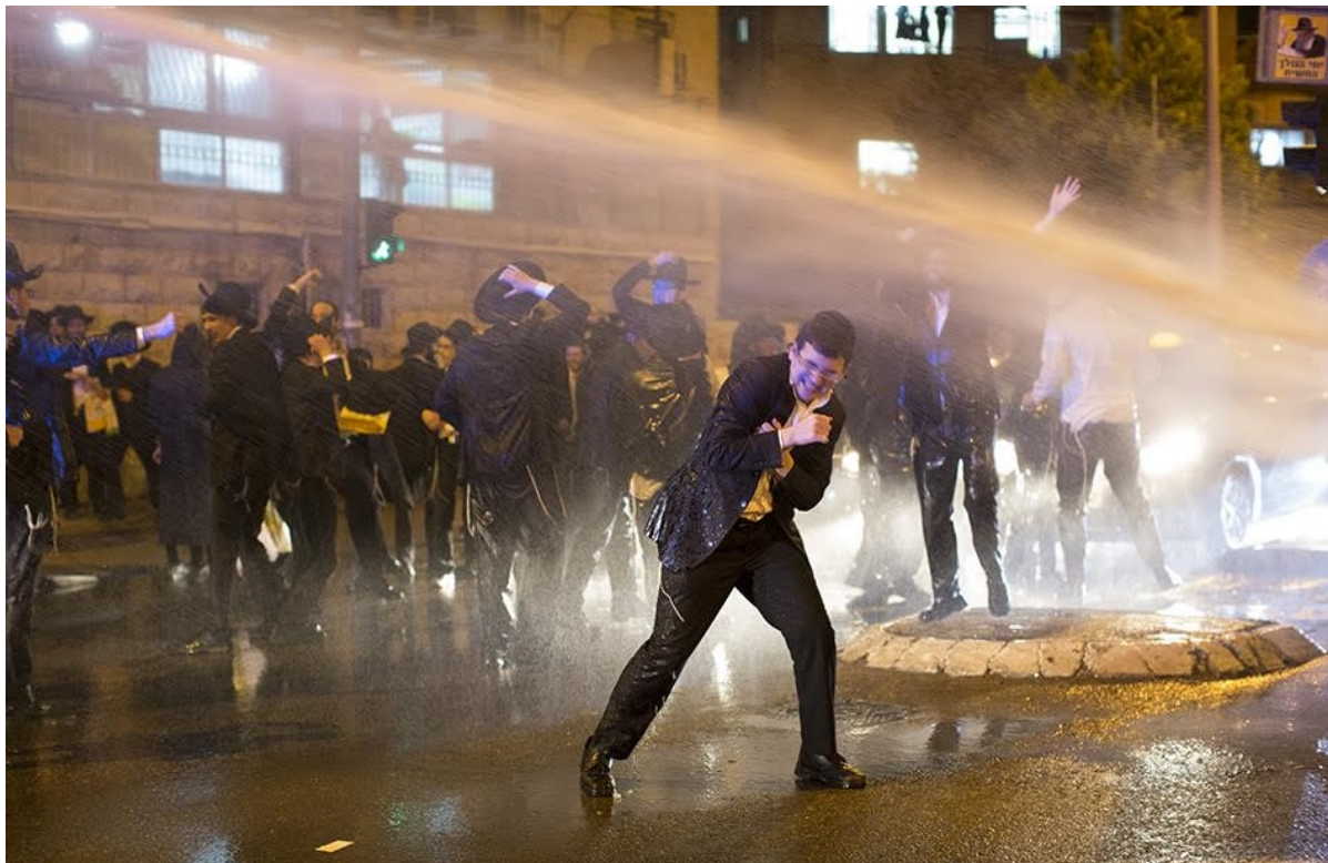
Полиция разгоняет акцию протеста харедим

или пережили Гитлера — переживем и сионистов