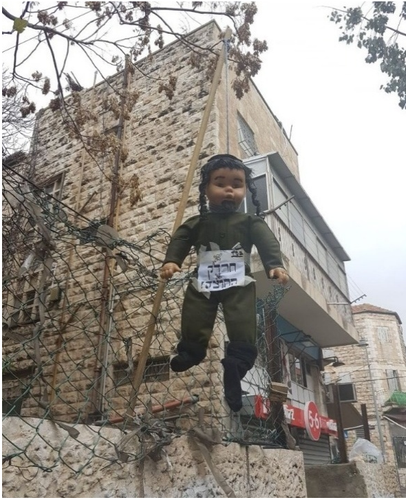
Кукла повешенного солдата-ультраортодокса, Меа-Шеарим, 2017