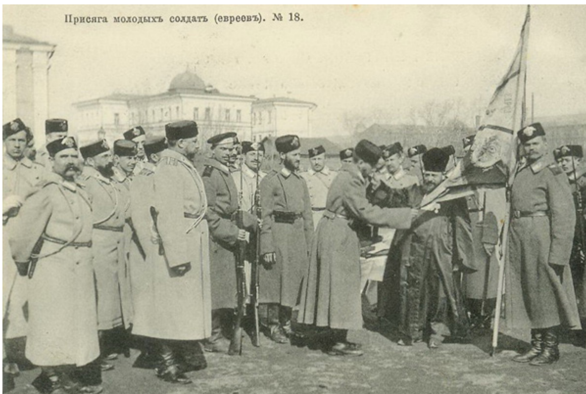
Присяга молодых солдат-евреев

— С превращением психиатрии в самостоятельную медицинскую дисциплину, то есть с последней четверти XIX века. Эта наука не имеет дело с органическими заболеваниями, и психиатрам надо было доказать, что они занимаются тем, что реально существует. Учитывая тогдашний интерес к проблемам наследственности, евреи, как преимущественно эндогамная группа, оказались удобным объектом для наблюдений. Так произошла ловкая подмена — не статистика свидетельствовала о склонности евреев к психическим заболеваниям, а наоборот, представления о евреях, как группе с определенными наследственными чертами, приковали к ней внимание психиатров.