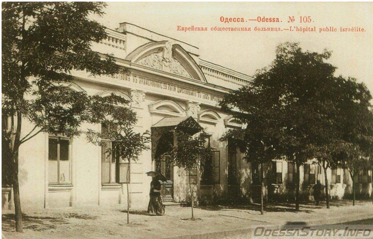
Одесса.—Odessa. № 105. Еврейская общественная больница.—L'hôpital public israélite.