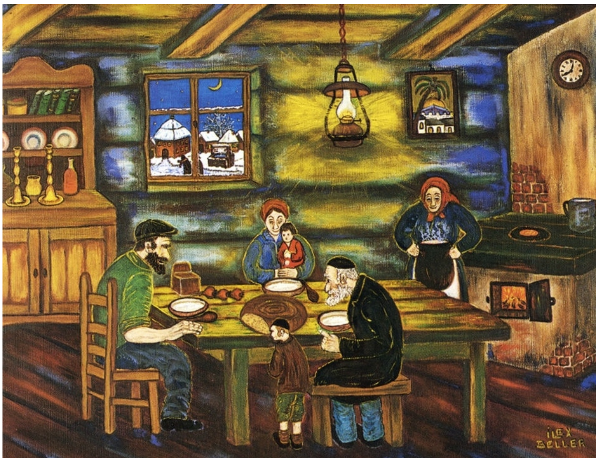
«Суп с картофелем», худ. И.Биллер

— Идеализация крестьянского быта в противовес еврейскому характерна для Гаскалы — просветители клеймили гетто и отсталые практики еврейской жизни, видя в близости к природе образец для подражания. Отчасти это имело рациональную основу — например, разреженность жилищ в украинском селе препятствовала распространению эпидемий, в то время как скученность домов в штетле ей способствовала.