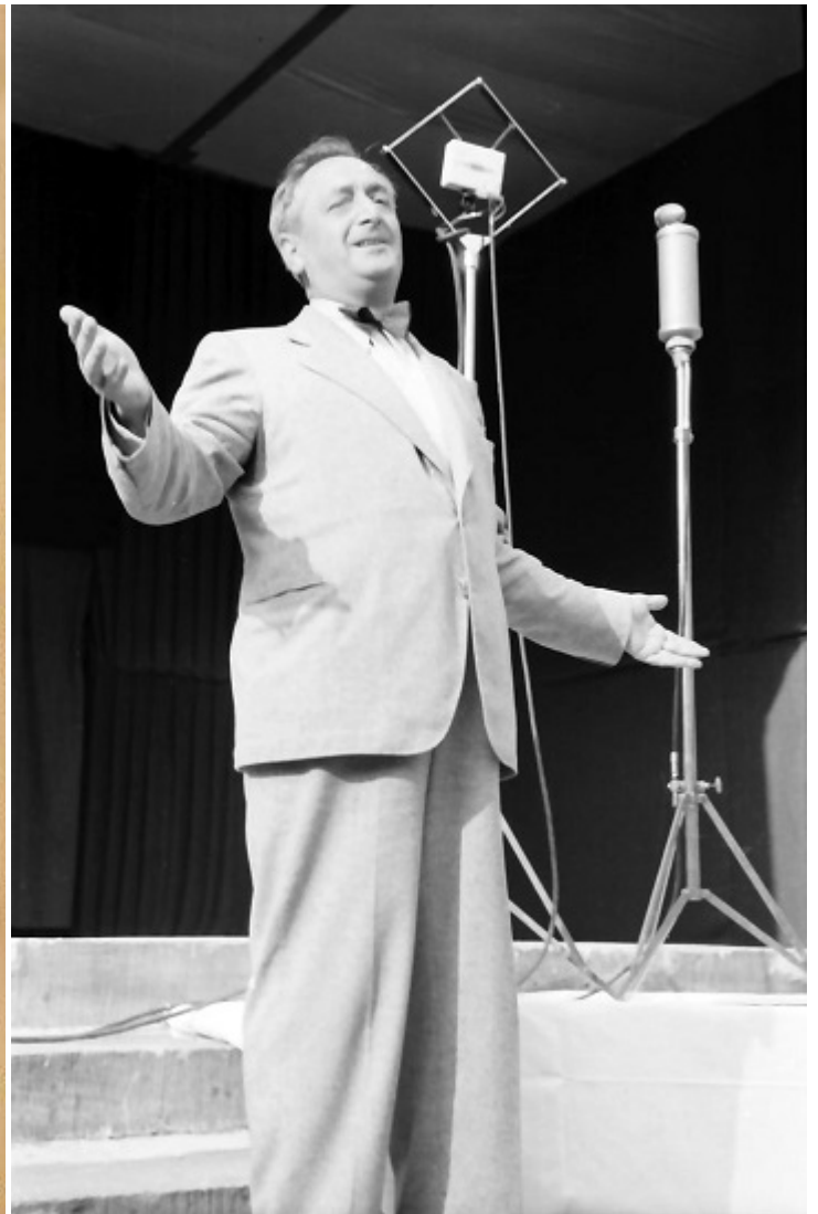
Ганс Мозер, 1940-ті

У ролі Лотти знялася Анні Мілеті, яка стала в 1925 році дружиною Бреслауера. Художника-єврея Лео зіграв Йоханнес Ріман, що не завадило йому в подальшому стати членом нацистської партії.